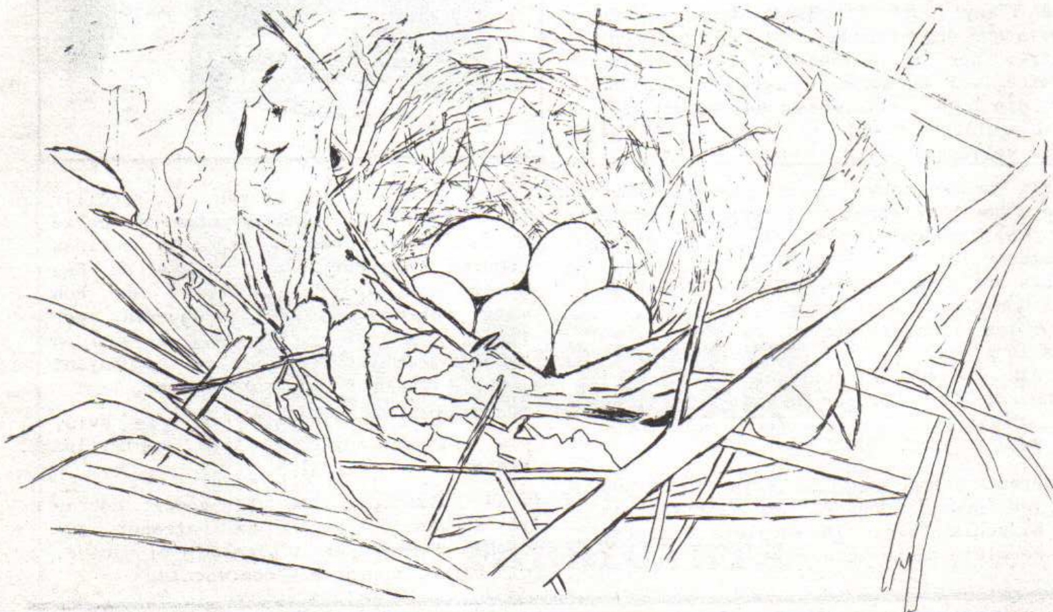
Niu de rosinyol ( Luscinia megarhynchos )

Esperem que amb aquest ingrés es reforcin els intercanvis i es millorin les relacions entre tots els anelladors d'arreu del país, pel bé de l'Anellament i de la Ornitologia en general.